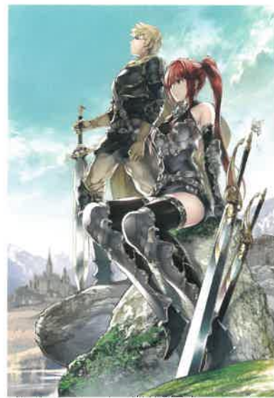
《Les Héros d'Avenir - アヴニール・エローズ - 》