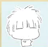
やまだ こうたろう 山田孝太郎

数多くの漫画・イラスト作品を手掛ける山田孝太郎氏の作品が集結。また、デビュー前の高校時代に描かれた貴重な作品もご紹介します。山田氏の手掛ける作品は、キャラクターはもちろん、衣装や武器、生き物など、細部に至るまで繊細で美しく描かれています。多様な絵柄で表現された作品ごとの世界観は圧巻です。この夏、日常を離れ、荘厳美麗で幻想的なイラストの世界を旅しませんか。